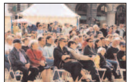
Mill-Góll, place du Parlement à Rennes.